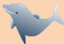
基本スケジュール